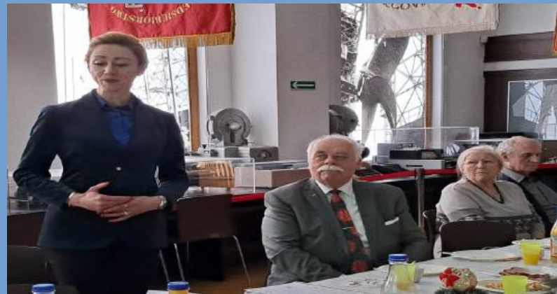
Wręczenie ryngrafu Gryfa Pomorskiego w historycznej sali BHP Stoczni Gdańskiej